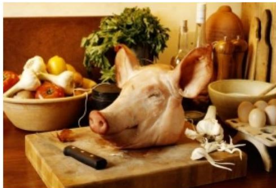
ZABÍJAČKA "U LUKÁČOV"